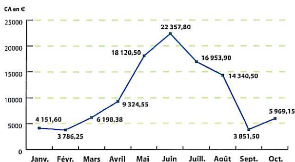
Courbe d'évolution du chiffre d'affaires des réservations en ligne en 2007

■ Nombre de visites ■ Nombre de visiteurs différents