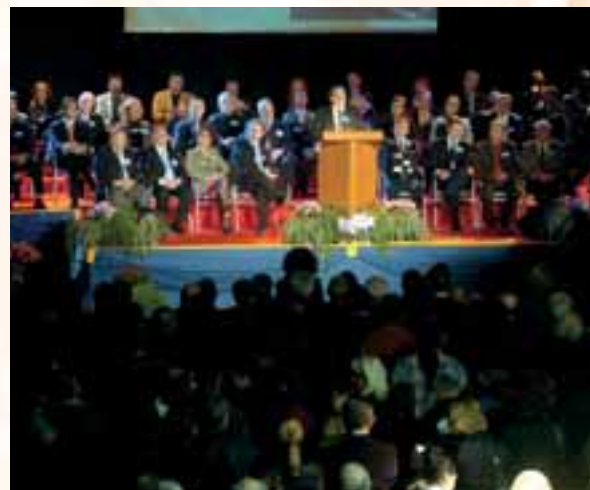
Le 19 janvier dernier, 2500 invités ont participé à la 2 ème cérémonie des vœux de la CCI Alès-Cévennes ; une soirée "V.I.P." organisée au Parc des Expositions de Méjannes-les-Alès.

Souvenez-vous, l'an dernier, lors de la première cérémonie des vœux de la CCI Alès-Cévennes, nous vous annoncions une nouvelle donne et des actions structurantes, à lancer dans l'industrie et le tourisme, pour le développement de notre bassin d'emploi et la pleine vitalité de nos commerces. Aujourd'hui, cette dynamique est en marche ! En quelques mois seulement, nous avons réussi à nous engager dans une nouvelle logique, une logique de projets et de progrès qui privilégie le développement du territoire et votre intérêt de ressortissant, que vous soyez industriels, artisans, commerçants, prestataires de services, spécialistes du tourisme ou porteurs d'affaires innovantes. C'est dans ce sens que nous avons agi jusqu'ici et c'est dans ce sens que nous agirons dans les années à venir.