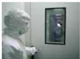
Aucun agent pathogène ne circule dans les unités de configuration L1 et L2.

Que vos lecteurs se rassurent, le site de MAbgène n'est pas à classer en Seveso 2 ! Nos unités sont de configuration L1 ou L2 et ne développent aucun agent pathogène. Les alésiens n'ont donc pas d'inquiétude à avoir, d'autant plus que dans notre secteur d'activité, les normes de sécurité et d'hygiène sont toujours très strictement respectées - la moindre impureté peut anéantir plusieurs semaines de travail !